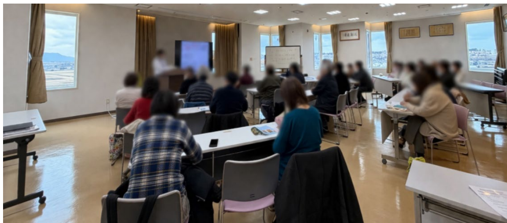
2026 年 3 月に開催した教室の様子

当院では、日本糖尿病学会専門医の資格を持つ医師と多職種のスタッフが連携し、さまざまな糖尿病診療に取り組んでいます。なかでも、毎月第 2 水曜日に行っている『外来糖尿病教室』という活動では医師や看護師、栄養士、薬剤師、臨床検査技師、理学療法士の担当スタッフが糖尿病患者さんの自己管理を支援するために講習会を多数企画しています。興味のある方はどなたでも参加可能です(当院糖尿病外来通院の方限定の企画もあり)。詳しい内容やその他の活動については、当院の掲示板やホームページなどをご確認ください。なお、ご不明な点がございましたら当院スタッフまでお気軽にお尋ねください。