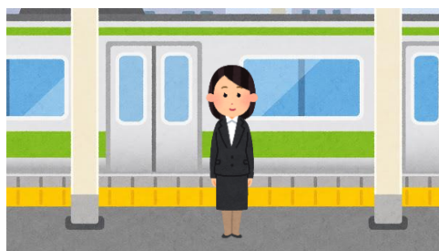
JR越後線 新潟大学前駅 下車