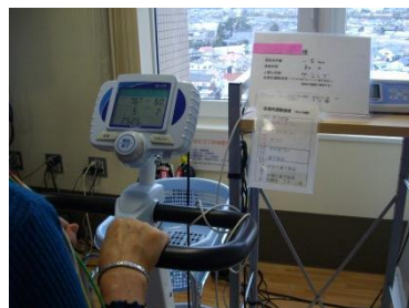
患者様も心電図モニターを確認できます