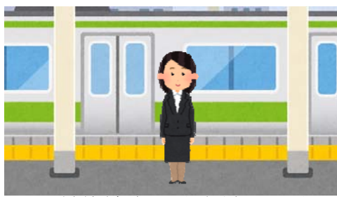
JR越後線 新潟大学前駅 下車