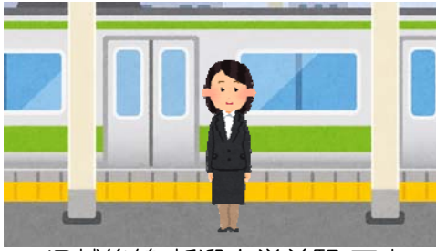
JR越後線 新潟大学前駅 下車