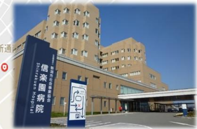
社会福祉法人 新潟市社会事業協会